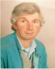
Début de carrière, 1983

Après avoir atteint la limite d'âge en date de son anniversaire le 18 juillet dernier, Dada a dû cesser ses fonctions de Sapeur-Pompier Volontaire au Centre de Secours du Claux.