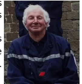
Fin de carrière, 2023

L'ensemble des Sapeurs-Pompiers du Claux le remercie pour son engagement. Ils comptent sur lui pour intégrer l'Equipe de Soutien Départementale comme réserviste afin de continuer à servir le centre de secours dans des missions non opérationnelles. En tant que retraité, il pourra poursuivre son investissement au sein de l'Amicale.